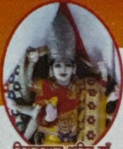
विराजमान शक्ति माँ