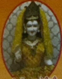
सती माँ ज्योत्सना देवी जी